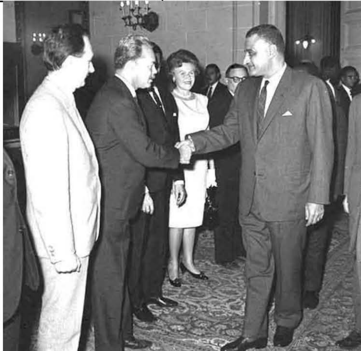
اجتماع عبد الناصر بلجنة تصفية الاستعمار التابعة للأمم المتحدة في اطار المؤتمر الشعبي بدمنهور